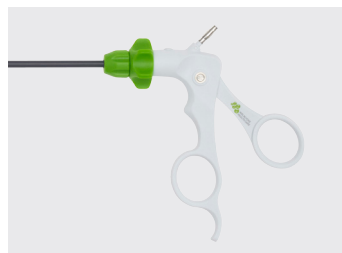
Håndtag, designet tilsvarende flergangsinstrumenter, Maryland.