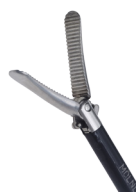
Fattetang - Duckbill