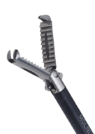
Skarptandet fattetang - Rat tooth