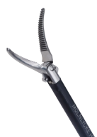
Dissektionspean - Maryland