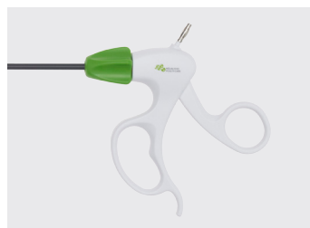
Håndtag, engangsdesign, Maryland.