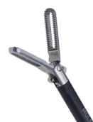
Fattetang - fenestreret